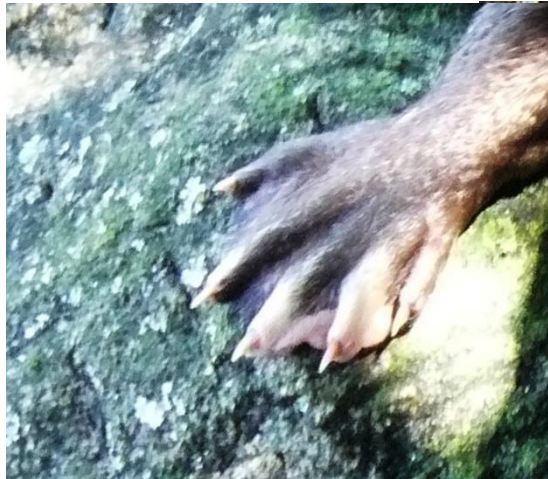
Patte antérieure gauche et empreinte (40-45mm de large)