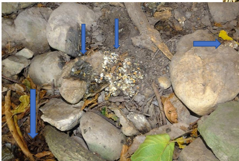
Les latrines de la loutre à cou tacheté peuvent s'étendre sur plusieurs mètres carrés.